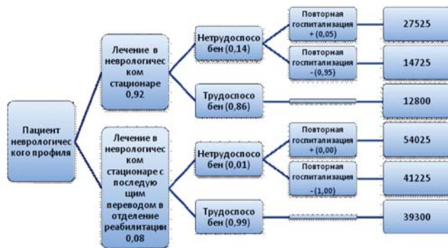
Рисунок 1. Дерево решений: стоимость лечения пациента неврологического профиля с использованием двух различных организационных технологий с учетом сохраняющейся нетрудоспособности.