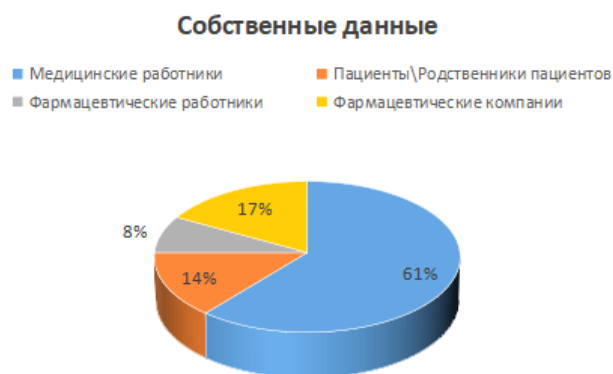
Рисунок 4. Распределение сообщений о нежелательных реакциях на лекарственные препараты по результатам собственного опроса (2025 г.)