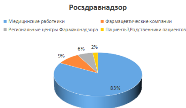
Рисунок 3. Распределение сообщений о нежелательных реакциях на лекарственные препараты в системе Росздравнадзора по категориям репортеров (2008–2024 гг.)

уведомлений поступает от пациентов и широкого круга «прочих» репортеров, российская модель в 2008–2024 гг. характеризуется доминирующим вкладом медицинских работников. При этом сообщения от фармацевтических компаний и региональных центров фармаконадзора занимают значительно меньшую долю, а участие пациентов и их родственников остается ограниченным.