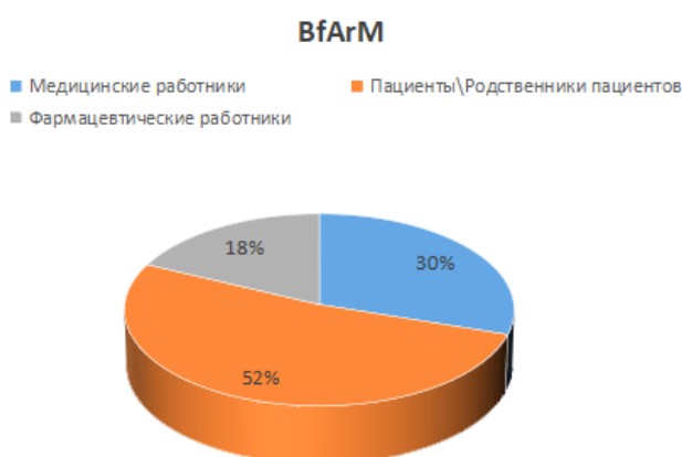
Рисунок 2. Распределение сообщений о нежелательных реакциях на лекарственные препараты в системе BfArM по категориям репортеров (2018–2020 г.)

На рисунке 2 представлены результаты по Германии, которые также демонстрируют выраженную роль непосредственных участников лекарственной терапии в формировании массива сообщений о безопасности. По данным исследования, проведенного Федеральным институтом лекарственных средств и медицинских изделий (нем. Bundesinstitut für Arzneimittel und Medizinprodukte BfArM), функционирующим в русле общеевропейских принципов EudraVigilance, в аналогичный период времени наибольшая доля сообщений поступала от пациентов и их родственников, тогда как медицинские работники формировали значимую, но меньшую часть уведомлений.